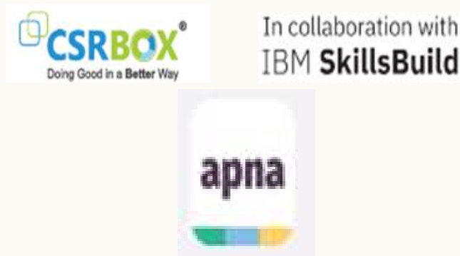
AICTE career portal- APNA.co