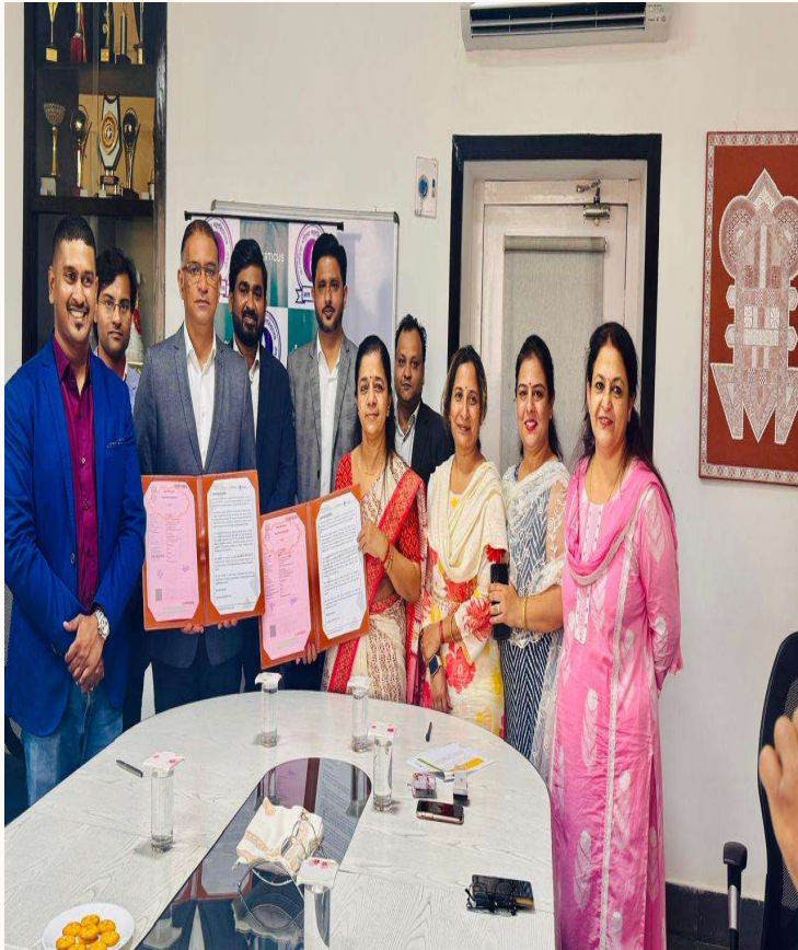
MOU- Imarticus Learning Pvt. Ltd.